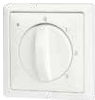
Standenschakelaar met filterindicatie