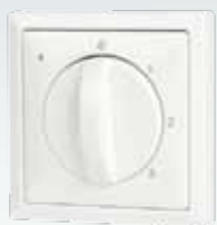
Standenschakelaar met filterindicatie